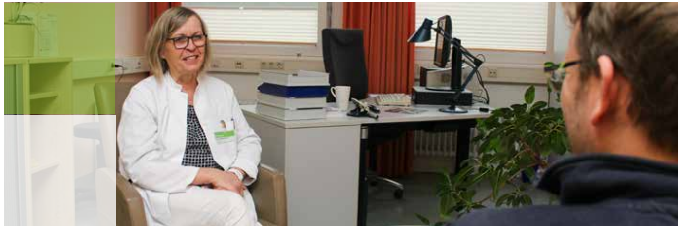
CA = Chefarzt | OA = Oberarzt

Folgende Fachrichtungen sind dabei involviert: