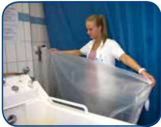
1. Die Ganzkörperfolie wird vorbereitet.

In der dermatologischen Praxis unseres Medizinischen Versorgungszentrums simulieren wir die Bedingungen am Toten Meer, um Patienten mit chronischen Hautkrankheiten zu behandeln. Balneophototherapie heißt die Behandlung, mit der Beschwerden bei Schuppenflechte und Neurodermitis gelindert werden können.