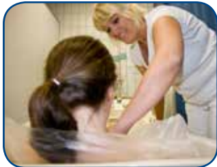
2. Das Salzwasser wird in die Folie gefüllt.