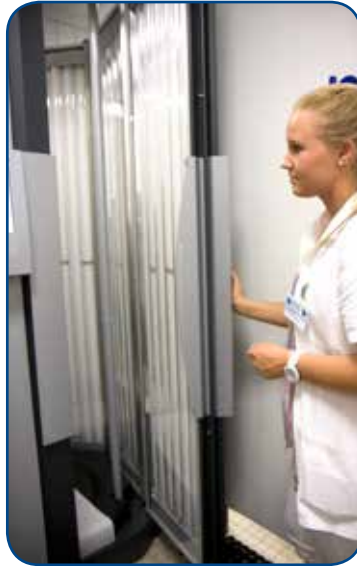
3. In der Kabine wird mit ultraviolettem Licht bestrahlt.